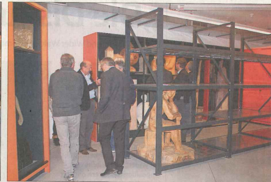
bon Le deposit nù dl Museum Ladin.